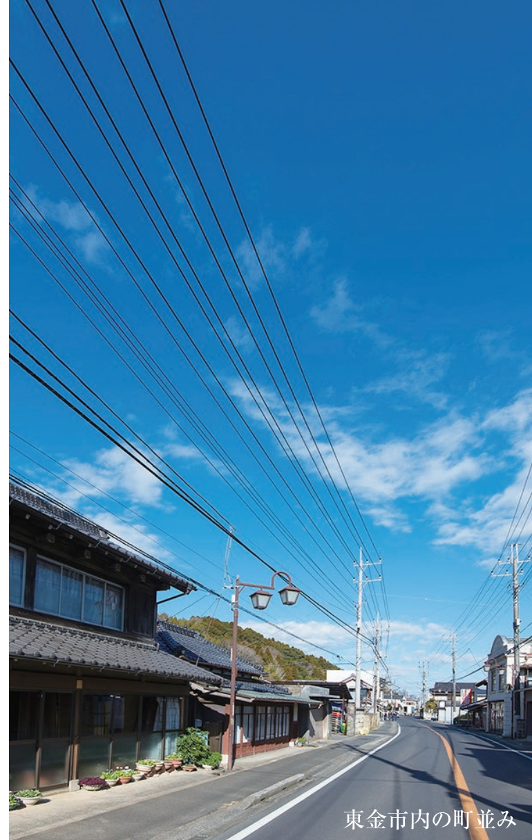
東金市内の町並み